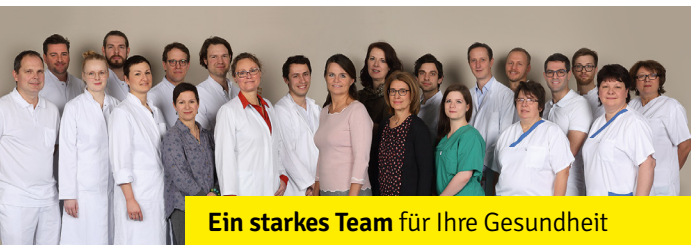
Ein starkes Team für Ihre Gesundheit

Bestimmte Medikamente zur Blutverdünnung (z.B. Marcumar, ASS, Plavix, Xarelto etc.) und Regulation des Blutzuckers (z.B. Metformin, Siofor etc.) müssen vor einem operativen Eingriff und in Rücksprache mit Ihrer/Ihrem niedergelassenen Ärztin / Arzt rechtzeitig abgesetzt oder umgestellt werden.